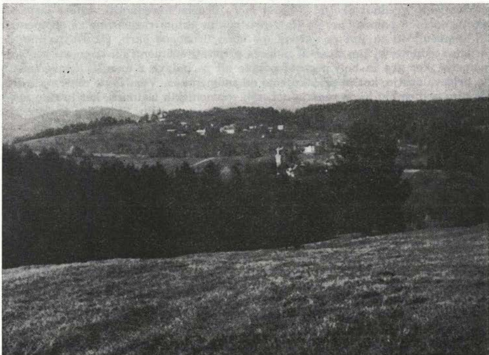
Sl. 14. Mala Slevica — panorama (Vavken 1984) Fig. 14 — Mala Slevica — the panorama (Vavken 1984)

Ce je naloga dolgoročnih planov usmerjati družbene procese in dogajanja v prostoru v daljših časovnih obdobjih (deset let in več), so srednjeročni družbeni plani s svojimi prostorskimi sestavinami namenjeni sprejemanju odločitev